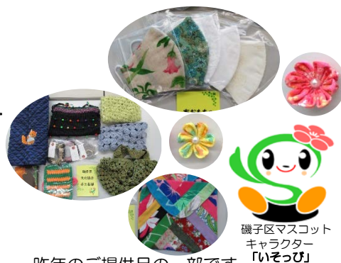
磯子区マスコットキャラクター「いそっぴ」 昨年のご提供品の一部です。

いそご区民活動支援センターでは、いそっぴゴールデンウィークのスタンプラリーに参加した方へお渡しする景品を大募集します。ぜひご協力ください!提供グループ名等は、表示して活動を紹介します。 お気軽にお問い合わせください。